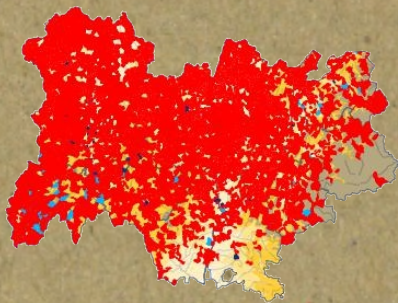
Répartition régionale - Source PIFH