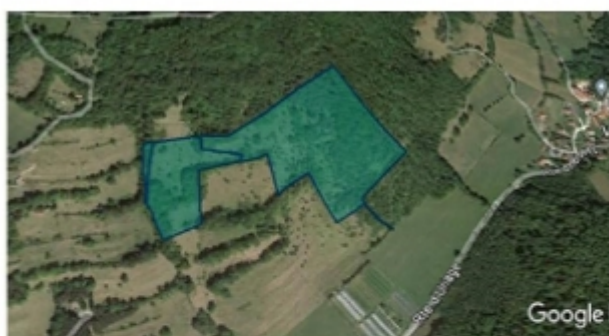
Parcelles communales de Champart classées Znieff

Une vingtaine de professionnels se sont retrouvés à la ferme du Goûter de Jean-Pierre à 13h autour d'un café puis sur la parcelle. Malgré un froid tenace et une pluie menaçante, tous ont tenu bon !